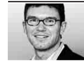
Von Peter Müller

Kochs Vorschläge sind für markige Schlagzeilen gut, doch taugen bei genauerem Hinsehen nicht alle Ideen. Da ist zunächst die Forderung, für 18- bis 21-Jährige das härtere Erwachsenenstrafrecht anzuwenden. Dabei können Gerichte dies längst – auch wenn das nicht die Regel ist. Hinter Kochs Vorstoß steckt die Ansicht, dass das Jugendstrafrecht von Sozialpädagogen erfunden ist und von Luschen angewandt wird. Dabei bietet das Gesetz die nötige Flexibilität, um zwischen einem 15-jährigen Ladendieb, der erstmals erwischt wird, und einem 20-jährigen brutalen Schläger zu unterscheiden.