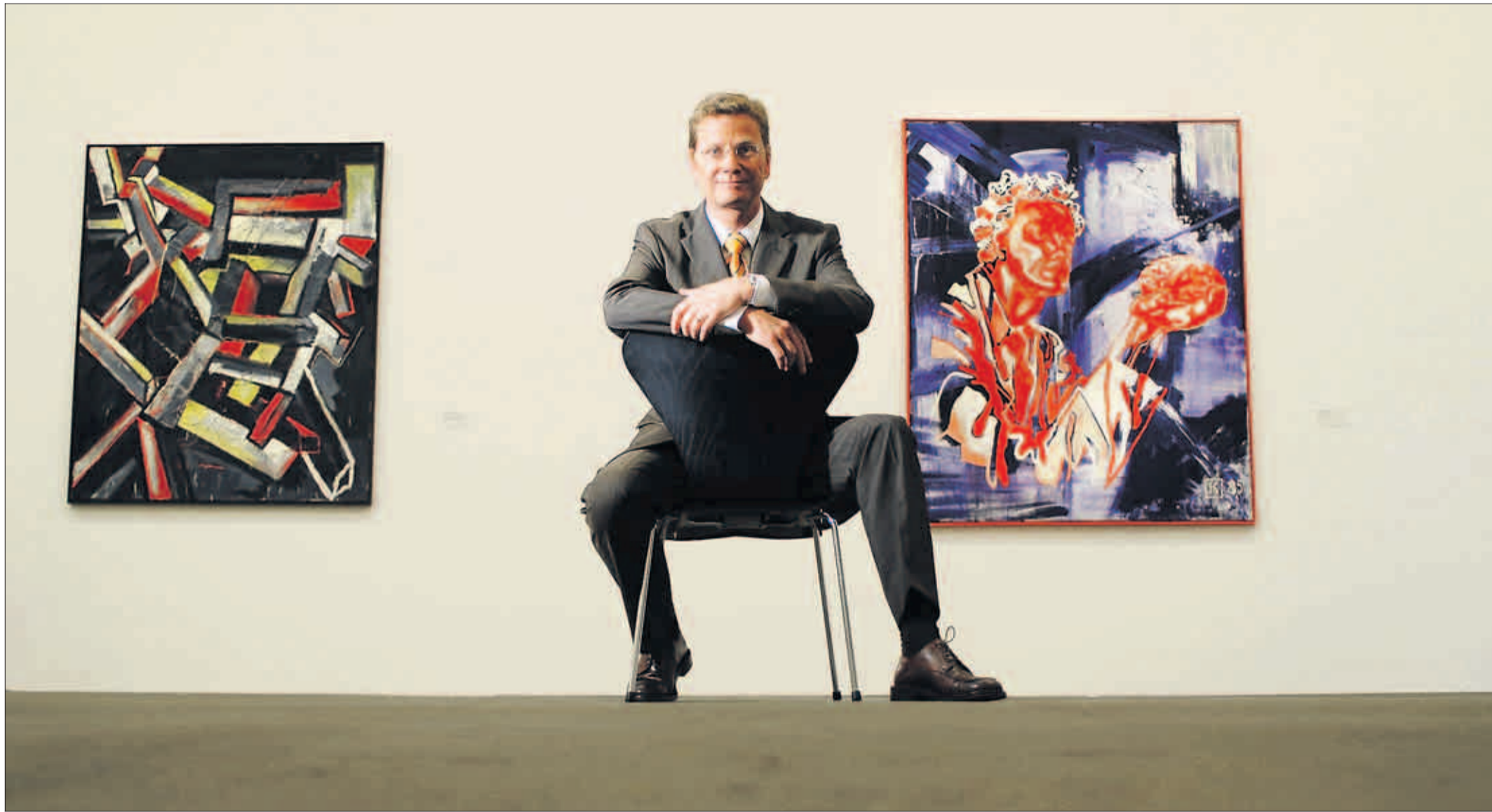
Liebhaber moderner Kunst: Guido Westerwelle vor zwei Gemälden von Martin Kippenberger im Berliner Museum für Gegenwart, dem Hamburger Bahnhof

Guido Westerwelle über linke Geschmacksrichter in der Kunst, die Fundamentalisierung der Grünen und den deutschen Hang zum Staatsinterventionismus