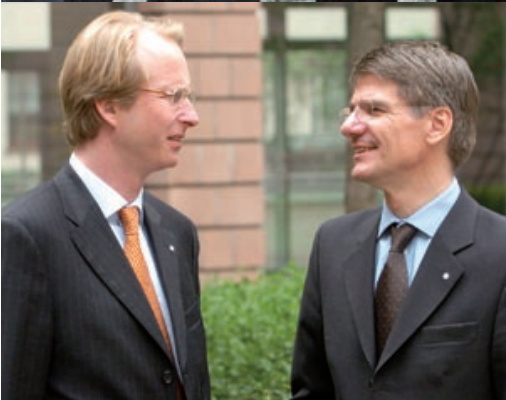
Wie alles begann Jahresversammlung Mai 2005 in Leipzig